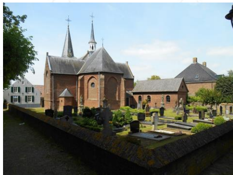
Heilige Antonius Abt kerk Bokhoven