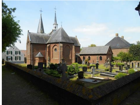
Antonius Abt kerk Bokhoven