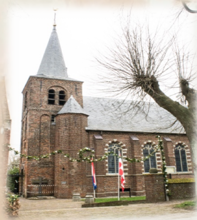
Heilige Antonius Abt kerk Bokhoven